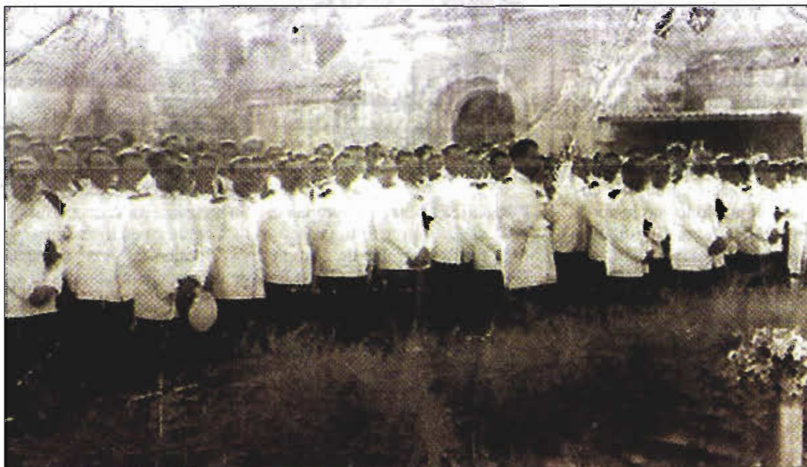
RECUERDOS. Una nueva asociación italiana impulsa la recuperación de la historia del acorazado "Roma" (imagen superior) cuyos marineros de escolta recalaban en Menorca. La foto inferior muestra la conmemoración del 60 aniversario del entierro de las víctimas del hundimiento.