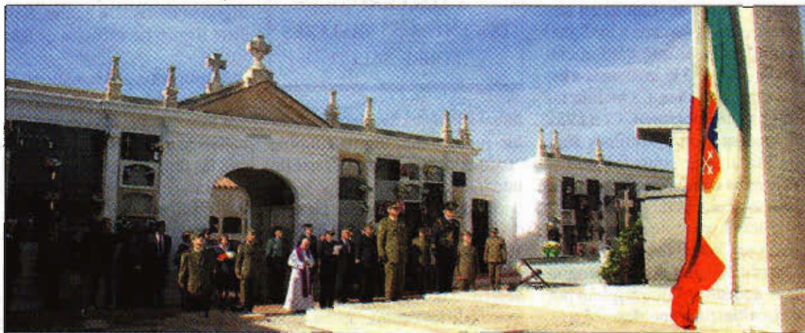
CEMENTERIO. Autoridades militares españolas e italianas realizaron la ofrenda floral a los difuntos